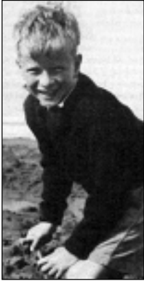
Andrew Wiles, 10 yaşlarında

NOVA: Birçok bilimsel buluş saplantı sonucu ortaya çıkıyor, ama sizde bu takımtı çocukluğunuzdan beri var.