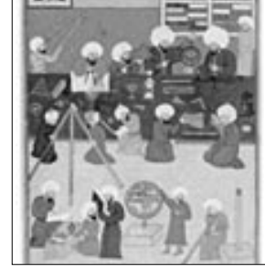
Takiyüddin ve arkadaşları, suçüstü yakalandıkları bir an.

lerine zarar vermeyecek kadar nişancıydılar ve "şimdi kimi topa tutsak acep" diye soracak kadar can sıkıntısından pathyorlardı ya da bu söylenti yanlış. Sonuçta gözlemevinde taş taş üstünde kalmaz. Takiyüddin hocamızın akibetini bilmiyorum. Melekleri biraz daha yakından tanımış olabilir.