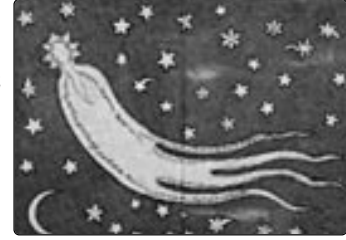
Veba salgınına yol açan 1577 kuyruklu yıldızı mikropolarını saçarken.

da bağlantı kuranlar işi azıttı Takiyüddin hocamız ve gözlemevi çalışanlarının geceleri yıldızları değil de "meleklerin bal-dırlarını dikizle-