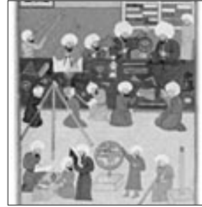
Takiyüddin ve arkadaşları, suçüstü yakalandıkları bir an.

lerine zarar vermeyecek kadar nişancıydılar ve "şimdi kimi topa tutsak acep" diye soracak kadar can sıkıntısından pathyorlardı ya da bu söylenti yanlış. Sonuçta gözlemevinde taş taş üstünde kalmaz. Takiyüddin hocamızın akıbetini bilmiyorum. Melekleri biraz daha yakından tanımış olabilir.