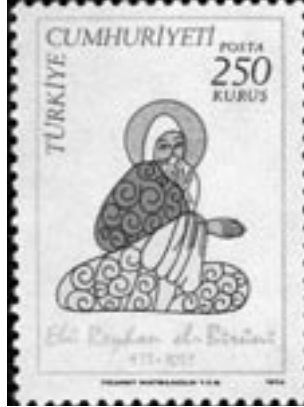
1973, el-Beyruni pulu

Harzemli'nin Hint kaynaklarına dayanarak astronomi cetvelleri de derlediği biliniyor. Ancak Arap astronomisine en büyük katkıyı yapan kişi el-Beyruni'dir (ya da Biruni'dir, 973-1048). Çok geniş kültürü olan Beyruni, Türkçe, Farsça, Sanskritçe, İbranice, Süryanice ve Arapça biliyordu. Astronomi, matematik, fizik ve tıp alanında çalışan Beyruni bir süre Hindistan'da yaşadı ve Hint bilim ve kültürünü inceledi. Daha sonra Gazne'ye yerleşen ve orada ölen Beyruni birçok kitap yazdı. Enlem ve boylamların hassas bir biçimde saptanması için yöntem geliştiren, dünyanın kendi etrafında döndüğünü - Galile'den 600 yıl önce - ilk öne süren odur. Beyruni'nin, ayrıca 18 kıymetli