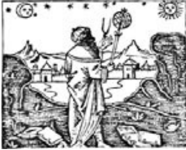
Abulmusar (787-886), Arap astronomu. 16'ncü yüzyılda yayımlanmış bir kitaptan

Araplar bu oyuncakları ve saatleri yalnızca yapmakla kalmamışlar, bunları anlatan kitaplar da yazmışlardır. Örneğin bunlardan