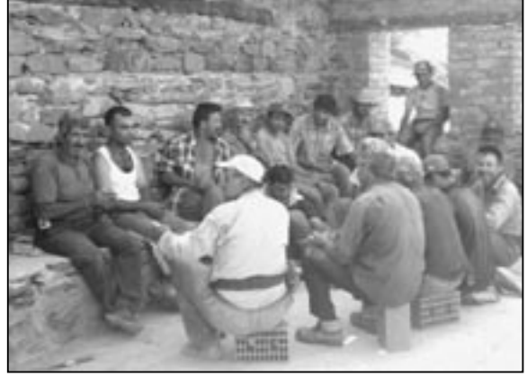
Ustalar öğle paydosunda

ormana kurduğum çadırımın hemen yanından. Homurdana homurdana koşuyorlardı. Galiba yerlerini almışız, pek mutlu bir ses değildi duyduğum. Biraz sonra da bir hayvancık uzun uzun ağladı, tilki ya da sansar olabilir, belli ki canı yanmış. Avcılar var civarda ve sabaha karşı çıkıyorlar ava. Akrep ve yılan nüfusu da az değil. Görmedik ama en-gerek varmış. Akrepler öldürmese de çok can yakıyorlar. Üç işçimizi soktular. Etrafta bir sürü at kafatası ve kemikleri var. Acaba kurtların ziyafet ye-