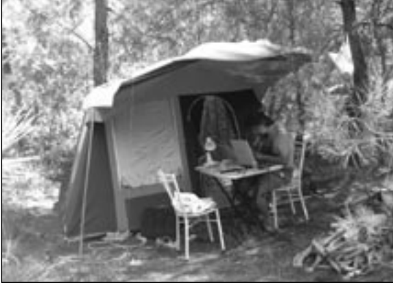
Bu satırları yazarken. Sağ alt köşede bir önceki gecenin ziyafetinden arta kalanları görüyorsunuz.

Önce araziyi temizledik, kuyu açıp su çıkarttık, elektrik getirdik. Para buldukça da ilerde evler yapmak üzere taş yığdık. Şimdi - çadırlar hariç - 55 ki-