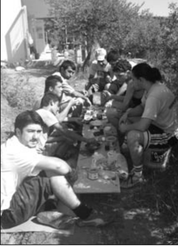
Gönüllüler öğle paydosunda

ormana kurduğum çadırımın hemen yanından. Homurdana homurdana koşuyorlardı. Galiba yerlerini almışız, pek mutlu bir ses değildi duyduğum. Biraz sonra da bir hayvancık uzun uzun ağladı, tilki ya da sansar olabilir, belli ki canı yanmış. Avcılar var civarda ve sabaha karşı çıkıyorlar ava. Akrep ve yılan nüfusu da az değil. Görmedik ama en-gerek varmış. Akrepler öldürmese de çok can yakıyorlar. Üç işçimizi soktular. Etrafta bir sürü at kafatası ve kemikleri var. Acaba kurtların ziyafet ye-