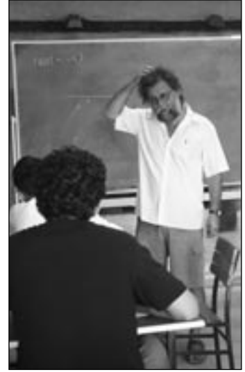
İzinsiz eğitim anında suçüstü...

Yazokuluna tam hız devam ediyoruz. Hiçbir güç bizi matematikten yapmaktan alıkoyamaz. ♥