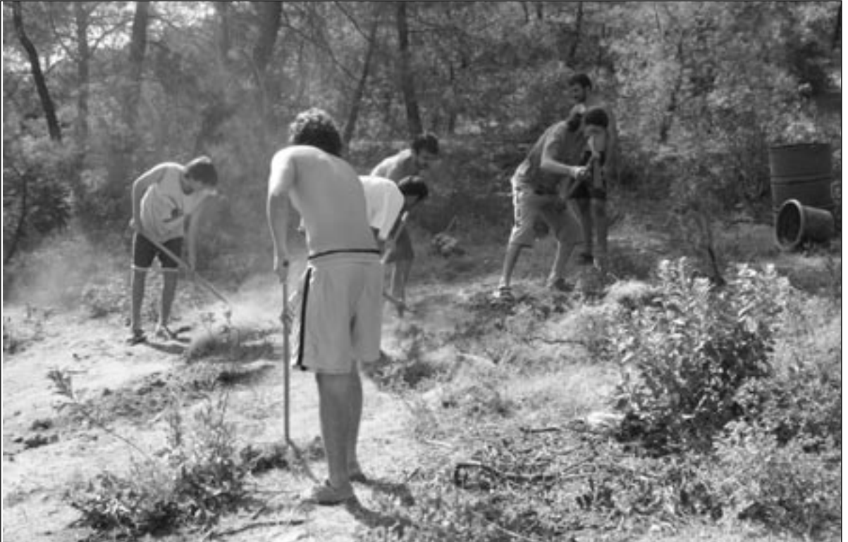
Çadır kurulacak yerleri düzlerken

Kaçak eğitim veriyordum... Bir eğitim kurumu kurulmuş, izni yokmuş... Eğitim kurumu yok ki izin alalım. Kimseden para almıyoruz, kayıt yok, diploma ya da sertifika verilmiyor, sınav yok, not yok. Sadece Nesin Vakfı'nın mekânını kullanıyo-