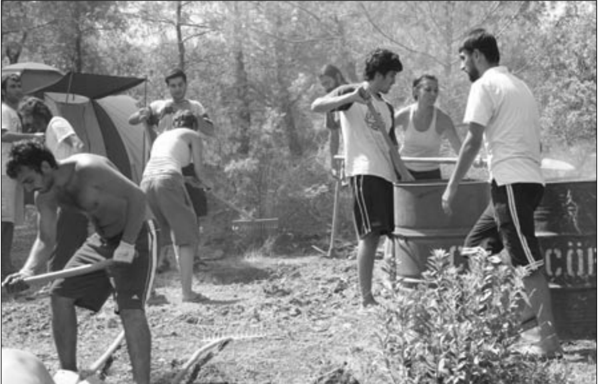
Çöplük haline gelmiş ormanı temirlerken

Milliyet'te çıkan “orman bizim oldu” demecim rencide etmiş, hakarete uğramış saymışlar kendilerini... Orman bizim oldu dediysek, arka cebimize koyup evimize götürdük demedik ya... Orman orda duruyor, üstelik eskisiden çok daha orman.