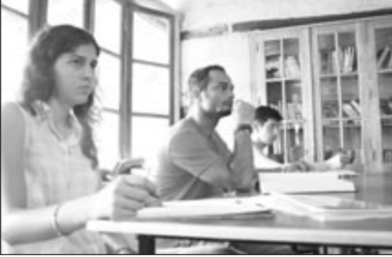
Ortak mekânda, derste.

Oluşumun adını buldum! Matematik Köyü... Cuk oturdu, çünkü tam bir köy burası. Yapılar taştan. Çamur ve saman karışımı bir bulamaçla sıvanıyor. Hamamların kubbesi de bir köy camiini andırıyor, bir minaresi eksik. Öte yandan ders yaptığımız ortak mekân sanki kovboy barı.