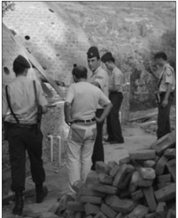
Matematik yazokulunun hamamı da mühürleniyor