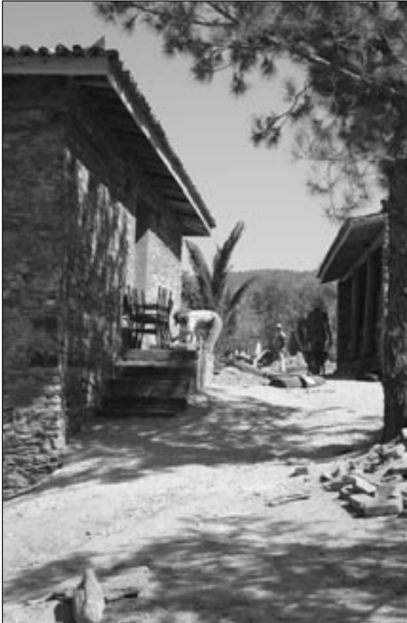
Köyün "Atatürk Bulvarı"

İnşaata bir hafta kadar durdurmaya karar verdik. Birkaç işçiyle devam ederiz ilerde. Ama para?