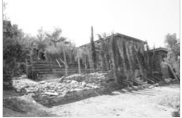
Açıkhava amfiteatri. Tam güneşten korunmak için çardak yapacaktık ki jandarma bastı.

olacağını idrak edip, ormanda çadır kurup kuramayacağımızı sordum komutana. Kurabilirmişiz. Öğrencilere dönüp,