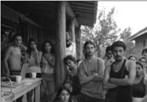
30 Temmuz baskınında. Bunu haketmedik bakışları

100 lira ne ki? Ama burada beni yaralayan davranış biçimi. Uyarsalar, 24 saat içinde kimlik bildiriminde bulunun deseler, biraz daha yakınlık gös-