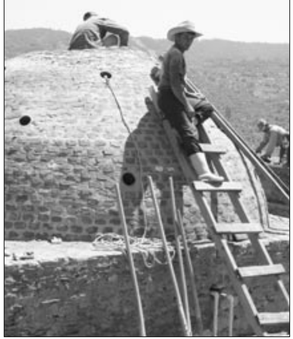
Köyün hamamı (Hamamsız matematik köyü mü olurmuş!)

hasında çıkmasını dilemişim. Ama şanssızlık bu ya, o gün çok tecavüz haberi varmış, bizim habere yer kalmamış. Sadece Ege ekinde bastılar haberi.