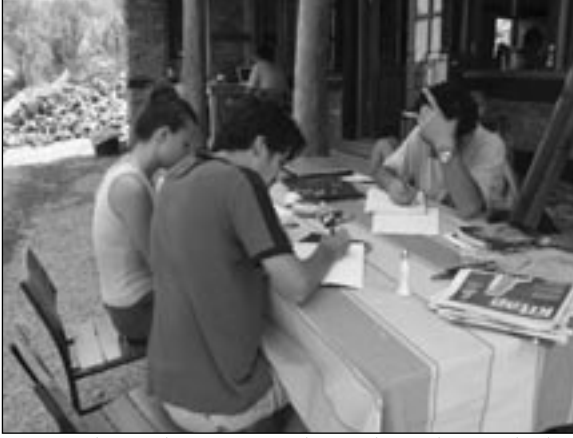
Kiminin buraya konsantrasyon kampı demesi boşuna değil...

mişiz... Diğer işlemler için de bir o kadar gerekiyor... Köylü nasıl izin alıyor?