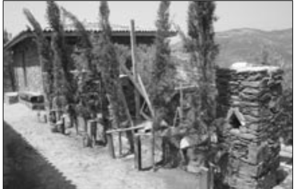
İnşaat durdurulduğuna göre ağaçlandırmaya çalışmalarına başlayabiliriz.

Öğrencilerin fotoğraf çekmesini yasakladılar. Neden diye sorduk. Bu bir baskınmış ve baskında